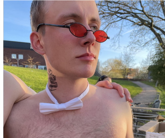
Figur 5: Gnuggisarna in action på temasläpp