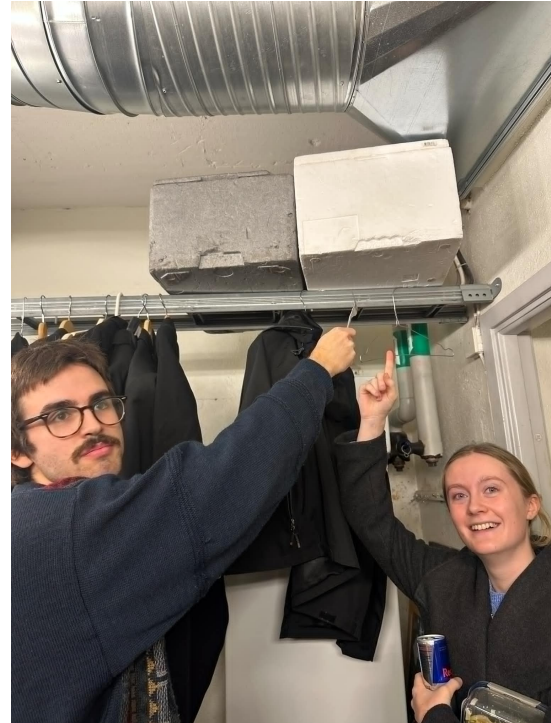
Figur 8: Frigolitlådorna i tryggt förvar i pubförrådet