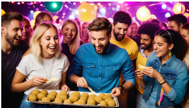
Figur 1: Schlarad-jobbare äter sina falafelrullar. Bild rekonstruerad i efterhand